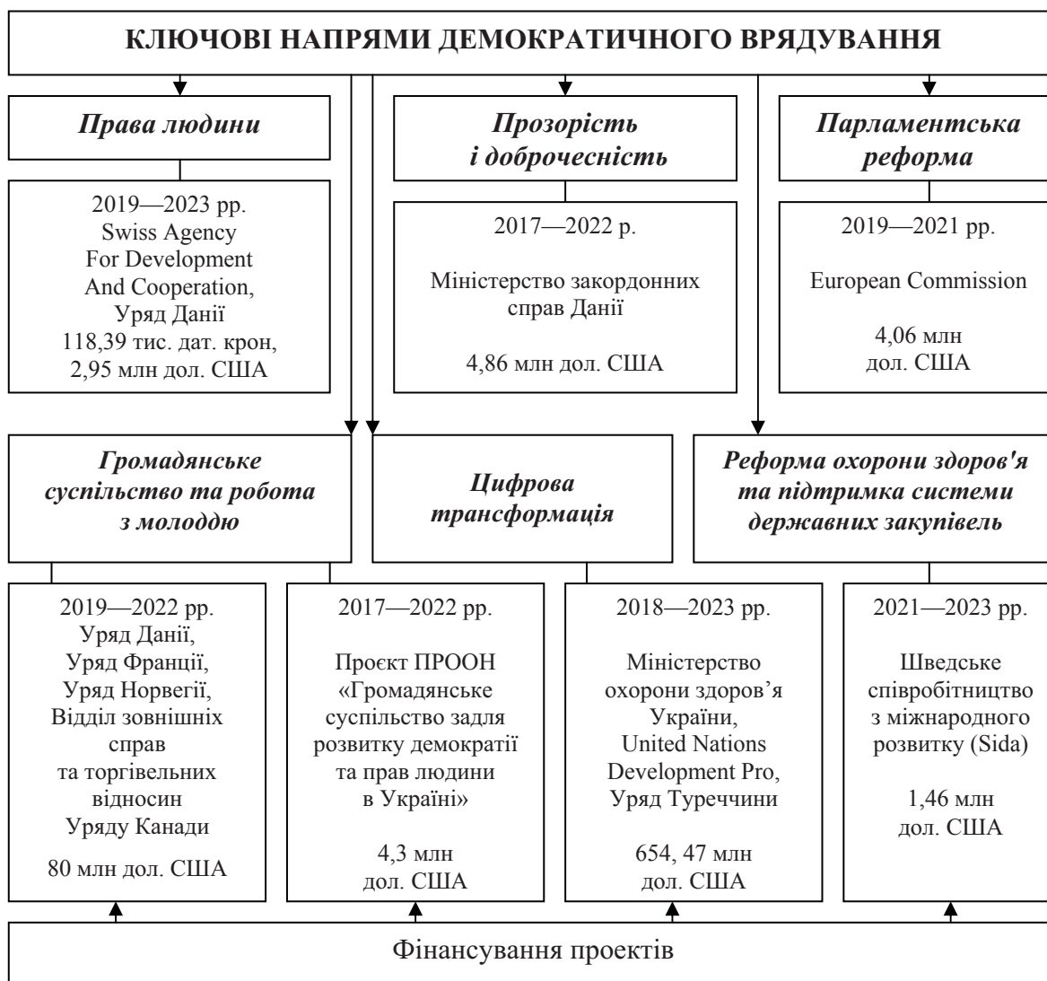
Рис. 1. Фінансування проектів за ключовими напрямками демократичного урядування в Україні